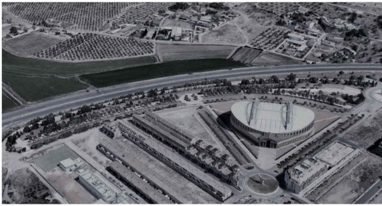
Zona del coliseo