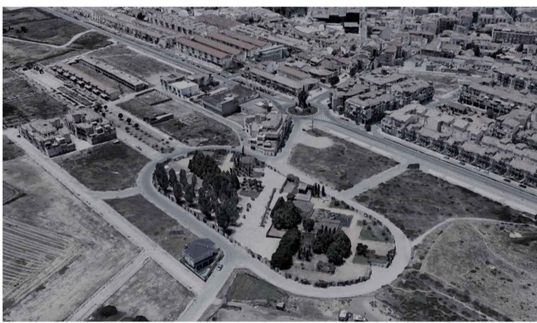
Zona parque de la hiqueruela