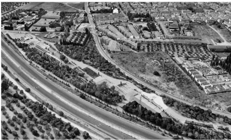
Zona del corredor verde