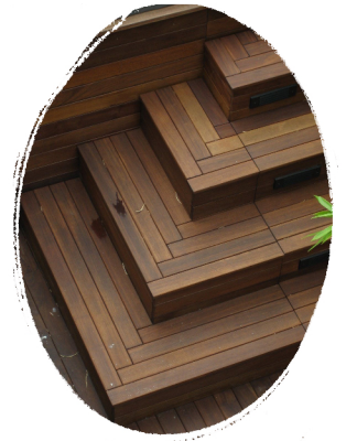
Madera de roble