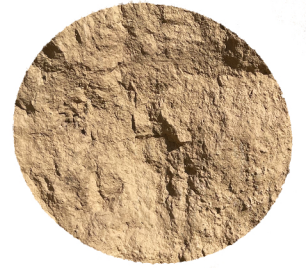
Piedra de los covartones