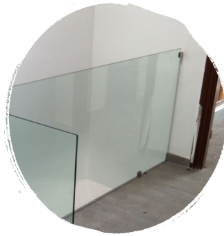
Barandilla de Cristal