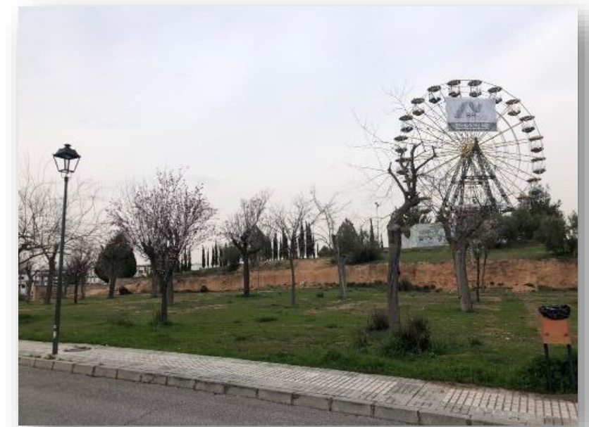
Vista del lugar de la escultura 1