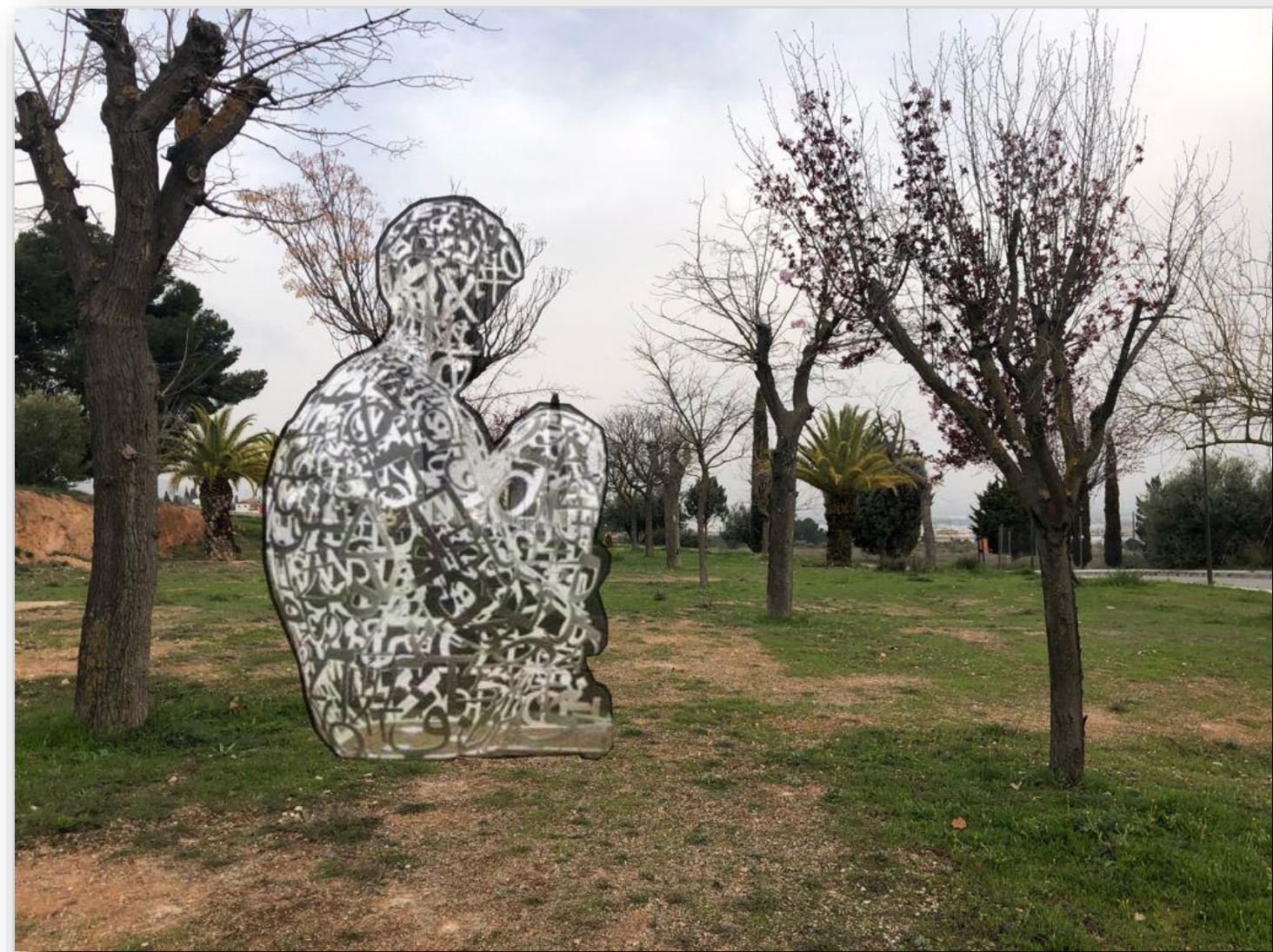
Vista con la propuesta

Alchemist se relaciona con otras obras de Plensa, Nomade (2010) y El Alma Del Ebro (2010), que están formadas por letras del alfabeto de acero inoxidable dispuestas al azar, pintadas de blanco y dispuestas en forma de persona sentada con las rodillas dobladas hacia arriba. el pecho. Sin embargo, en lugar de letras del alfabeto, el trabajo de Plensa para el MIT se crea a partir de símbolos numéricos, como un "homenaje a todos los investigadores y científicos" que han contribuido al conocimiento científico y matemático.