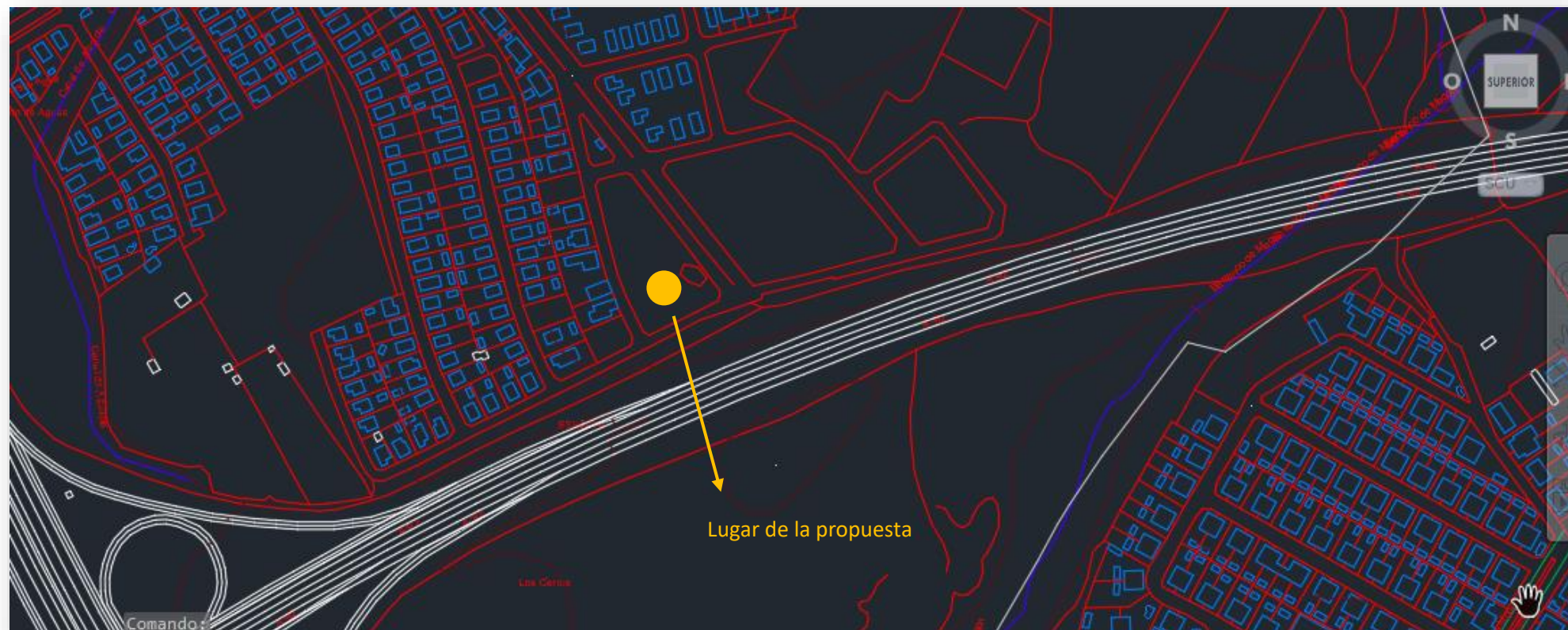
Mapa Municipio 1