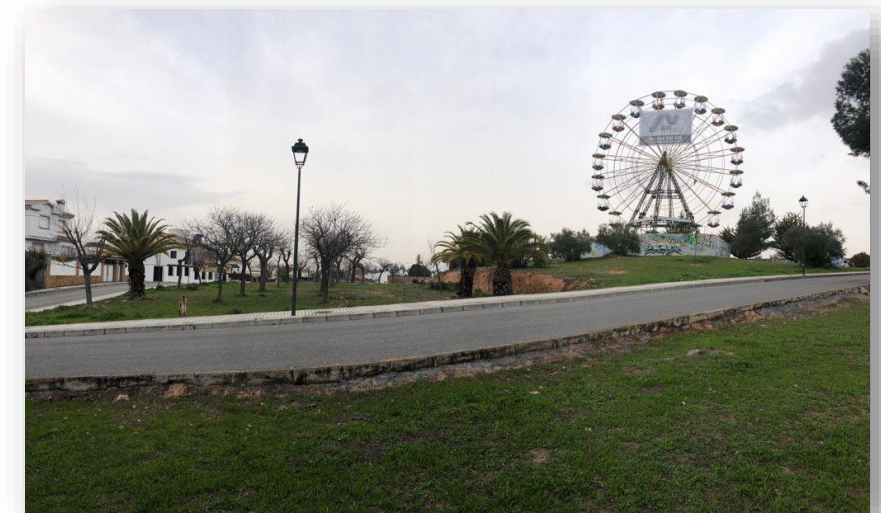
Vista del lugar de la escultura 2