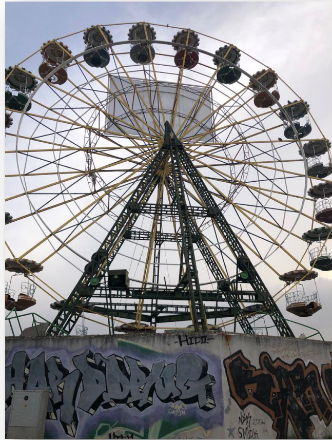
Noria de Loma Verde

La estructura, de veinte metros de altura, se halla en zona verde, está asida al suelo por vientos de acero, cercada por un tapial y lleva tres décadas sin mantenimiento