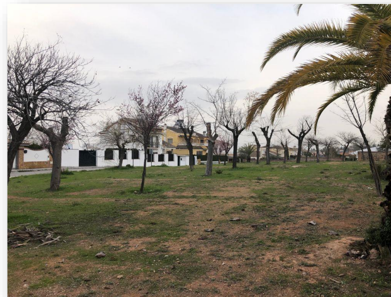
Vista del lugar con la propuesta