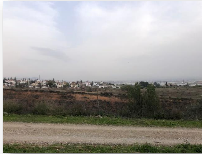
Vista de la Sierra

¿Cómo llamar la atención de los potenciales compradores? Pues plantando una preciosa noria de veinte metros de altura y veinte canastillas. Eso fue lo que hizo Ávila Rojas a finales de los ochenta, cuando inició la urbanización de estos terrenos situados en la confluencia de la A-44 y la A-92. La misma noria que sigue ahí, en lo alto de la loma, tres décadas después.